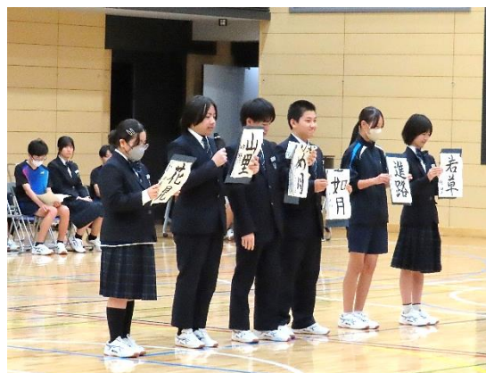
部活動 説明の例 (書道部)