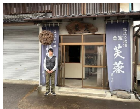
長野県佐久市 芙蓉酒造協同組合