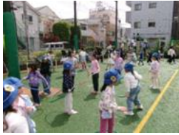
中休み はじめての外遊び

入学から、早くも1ヶ月が経とうとしています。子供たちはみんな、毎日新しいことを学び、一つ一つのことを積み重ね、楽しみながら過ごしています。休み時間にのびのびと外で遊んだり、給食を美味しく食べたりと、学校生活にも慣れてきている様子です。先日は、2年生と一緒に学校探検をしました。一緒に校内を回ること、特別教室のことも知ることができました。運動会の練習も始まりました。行事や日々の出来事を通して、さらにたくましく成長してほしいと願っています。