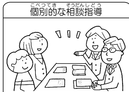
個別的な相談指導

学校給食は、児童の健康の維持・増進を図り、望ましい食習慣と食に関する実践力を身につけるために重要な教材です。また、日本の伝統的な食文化の理解と関心を深めます。