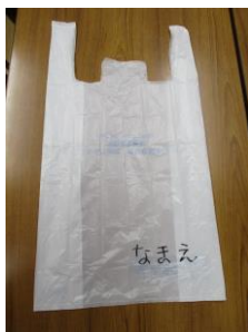
《大きいビニール袋》