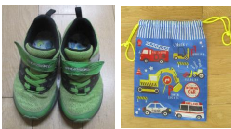
《園庭用運動くつ・くつ入れ》