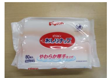
《おしりふき用ナップ》