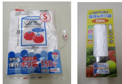
《小さいビニール袋》