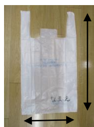
《汚れた洋服を入れる袋》