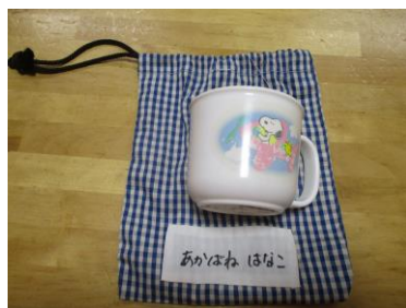
《コップ・コップ袋》