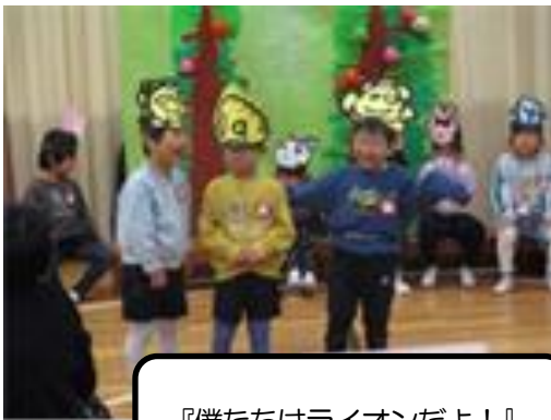
『僕たちはライオンだよ!』

今回の生活発表会の経験を踏まえて、ほし組・にじ組で過ごす残り少ない生活の中でも、みんなと一緒に取り組む楽しさや自分の力を発揮する喜びを感じられるようにしていきたいと思っています。