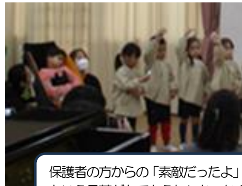
保護者の方からの「素敵だったよ」「頑張ったね」という言葉がとてうれしかったようです。