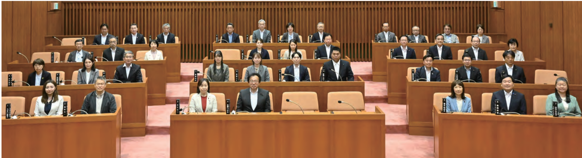
令和8年第1回臨時会での撮影

No. 307 発行/北区議会 〒114-8508 東京都北区王子本町1丁目15番22号 TEL 03(3908)9948