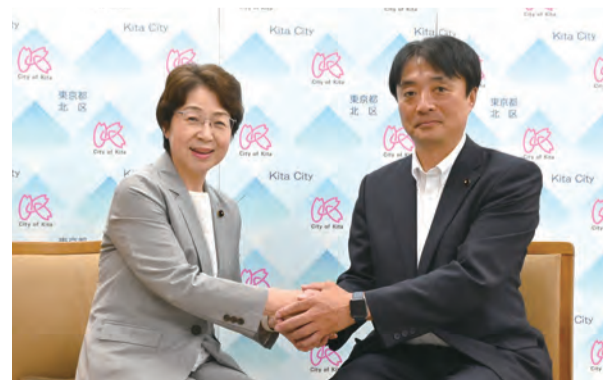
左：青木 博子 議長 右：花見 たかし 副議長

北区議会では、各会議において通年にわたり、気候に応じた服装(ノーネクタイ、ノー上着可等)としています。区民の皆様のご理解とご協力をお願いいたします。