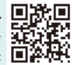
北区商店街連合会 HP

【問】 北区商店街連合会事務局 ☎(5390)1200 産業振興課商工係 ☎(5390)1235