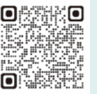
日本年金機構HP (学生納付特例)