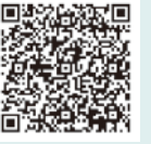
区HP (後期高齢者医療制度)