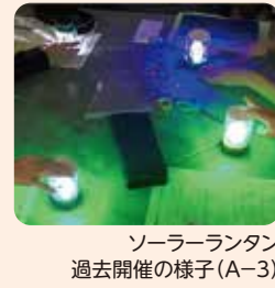
ソーラーランタン 過去開催の様子(A-3)