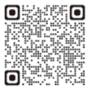
区HP (防災用品あっせん)