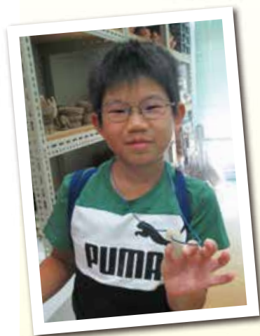
夏休みまがたま 夏休み勾玉づくり教室

問場 北区飛鳥山博物館 王子1-1-3飛鳥山公園内(月曜休館) ☎(3916)1133