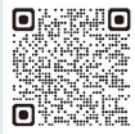
日本年金機構HP (免除・納付猶予制度)