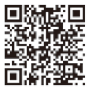
区HP (感震ブレーカー)

【配布窓口】 防災・危機管理課(区役所第一庁舎2階13番)、各地域振興室、各区民事務所、区HPほか 【問】 防災・危機管理課 ☎(3908)8184