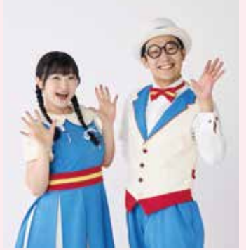
あおぞらワッペン