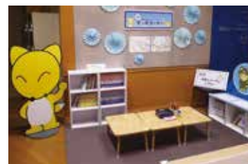
プチきっずコーナー

体験学習室前には、図鑑や学習マンガなどを読むことができる「プチきっずコーナー」を特設します。