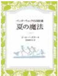
「ペンダーウィックの四姉妹 夏の魔法」ジーン・バースオール/作 代田亜香子/訳 小峰書店

日7月11日(土) 午後1時30分~3時 場中央図書館3階ホール(十条台1-2-5) 内参加者同士で課題本についての感想を話し合います。一人で読むのとはまた違った本の読み方を楽しむ会です。小中高生の参加も大歓迎です。今回の課題本は『ペンダーウィックの四姉妹 夏の魔法』(ジーン・バースオール/作)です。 [あらすじ]ペンダーウィック家の四姉妹とお父さん、それに愛犬のハウンドは、噴水や花壇、大理石の像がある、広いお屋敷で8月の三週間を過ごすことになります。しかしそこでは命からがらの事件が次々に起こります。どんな困難にぶつかっても「ムーブス」という集会で姉妹が結束して事件の解決に向かいます。 申当日、直接会場へ 問中央図書館事業係 ☎(5993)1125