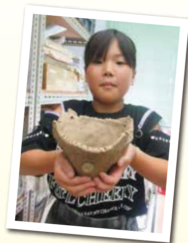
夏休み土器づくり教室