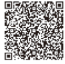
区HP (育休代替任期付職員)

保育士・保育士[経験者]・育休代替任期付職員 [申込開始日]6月15日(月) [第一次選考]8月23日(日) ※育休代替任期付職員を除く ※詳しくは区HPの募集案内をご覧ください。 問先職員課人事係 ☎(3908)8031