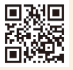
北区文化振興財団HP