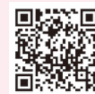
北区プレーパークHP