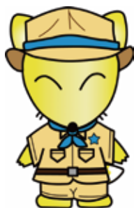
博物館 オリジナルキャラクター コン吉

内 北区のさまざまなナゾを調べる「コン吉探検隊」が、飛鳥山博物館にやってきた。どうやら今年の博物館にはたくさんのナゾがあるようで…。探検隊の一員としてコン吉隊長たちをサポートしながら、博物館のナゾを解き明かそう。全てのナゾを解くと、探検隊の「隊員章」がもらえます。