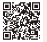
ボランティアぶらざHP