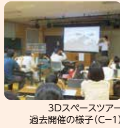
3Dスペースツアー 過去開催の様子(C-1)