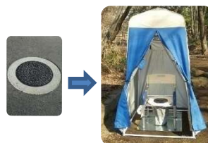
【災害のときに使うマンホールトイレ】