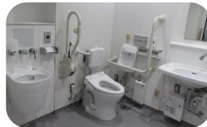
【バリアフリートイレ】