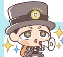
東京北区スペシャル プランニングサポートしずむさく