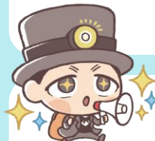
東京都北区スペシャルプランニング サポーター しずむくん