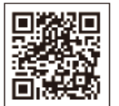
北区メールマガジン 新規登録サイト

https://plus.sugumail.com/usr/kita-city/home