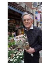
ドナルド・キーン氏