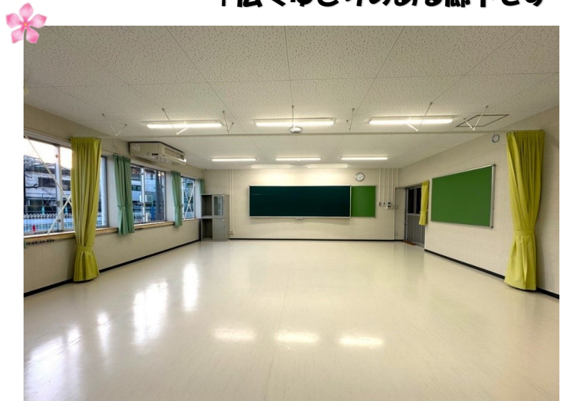
↑引越し前の普通教室です 春休み中に机と椅子が移動してきます