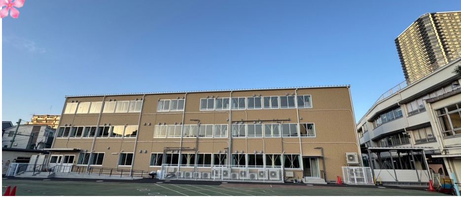
↑仮設校舎外観です 渡り廊下で本体校舎と繋がっています

昨年の夏に工事を開始した仮設校舎が完成しました。プレハブ造軽量鉄骨の3階建てです。内外の様子を一部ご紹介します。