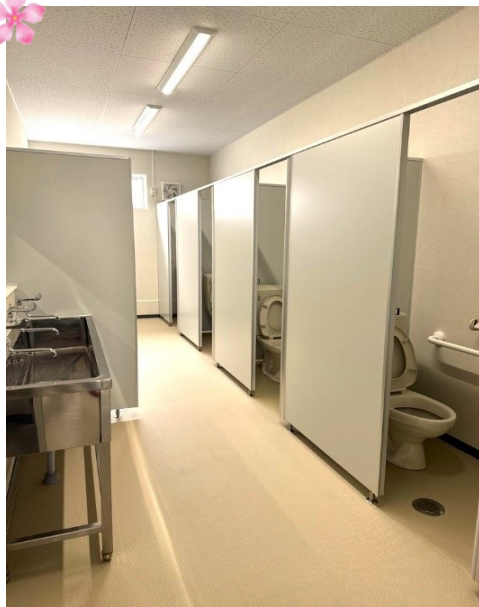
↑各階に綺麗なトイレを設置しています