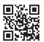
東京都南新宿検査・相談室サイト(QRコード)

予約は、東京都南新宿検査・相談室の携帯サイトからできます。QRコードを携帯のカメラで読み取り、携帯サイトへアクセスしてご予約ください。