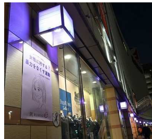
商業施設での パープルライトアップの様子