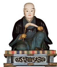
太田道灌坐像（静勝寺）