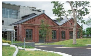
中央図書館（赤レンガ図書館）

主な見どころ 醸造試験所跡地公園、滝野川病院一帯 四本木稲荷神社、中央公園文化センター、中央図書館