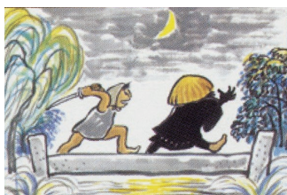
てっかんぼうが出たぞ（甚兵衛堀跡） 【北区の昔がたり 北区郷土資料館シリーズⅩ】 北区教育委員会発行