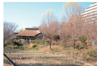
赤羽自然観察公園