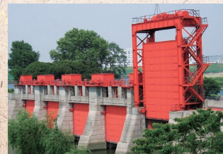
赤水門（旧岩淵水門）