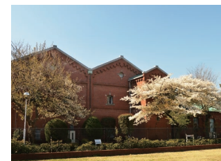
旧醸造試験所第一工場

主な見どころ 洋紙発祥之地碑、旧醸造試験所第一工場 旧渋沢庭園（晩香廬・青淵文庫）、西ヶ原一里塚