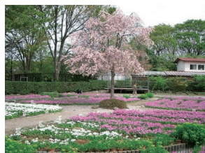
浮間ヶ原桜草園場

主な見どころ 荒川防災ステーション、観音寺 氷川神社、浮間ヶ原桜草園場、北向地藏堂