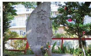
忠魂碑（四本木稲荷神社）