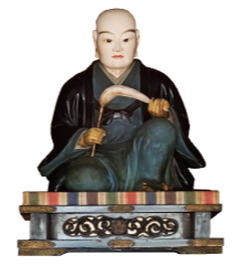
太田道灌坐像 (静勝寺)