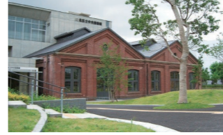
中央図書館 (赤レンガ図書館)

主な見どころ 醸造試験所跡地公園、滝野川病院一帯 四本木稲荷神社、中央公園文化センター、中央図書館