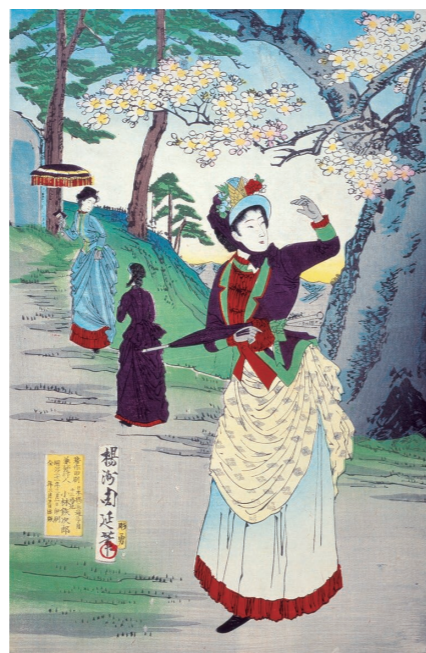
「飛鳥園遊覧之図」(部分) 梅洲周延画 明治21年 北区飛鳥山博物館所蔵