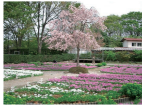
浮間ヶ原桜草園場

主な見どころ 荒川防災ステーション、観音寺 氷川神社、浮間ヶ原桜草園場、北向地藏堂