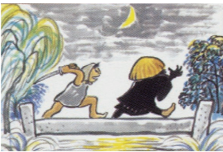
てっかんぼうが出たぞ (甚兵衛堀跡) 【北区の昔がたり 北区郷土資料館シリーズX】 北区教育委員会発行