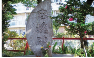
忠魂碑 (四本木稲荷神社)