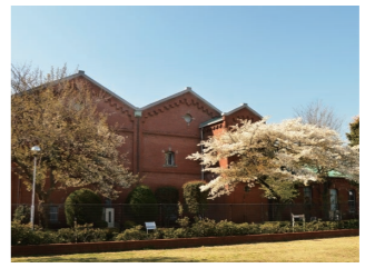
旧醸造試験所第一工場

主な見どころ 洋紙発祥之地碑、旧醸造試験所第一工場 旧渋沢庭園 (晩香廬・青淵文庫)、西ヶ原一里塚