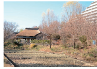
赤羽自然観察公園