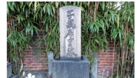
正岡子規墓 (大龍寺)

主な見どころ 田端文士村記念館、童橋公園 (室生 犀星旧居の庭石)、芥川龍之介旧居跡、 天然自笑軒跡、東覚寺、大龍寺