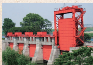
赤水門 (旧岩淵水門)