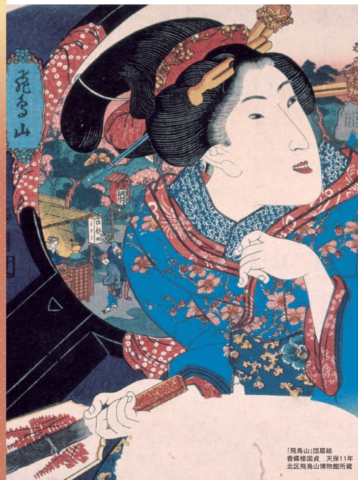
「飛鳥山」団扇絵 香蝶楼国貞 天保11年 北区飛鳥山博物館所蔵