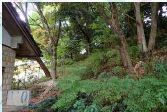
武蔵野台地の突端に位置する自然園の斜面林