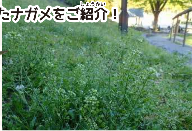
こんな草むらにいます

ナガメはアブラナ科の植物の実の汁を吸うので、 ナズナ（ぺんぺん草）やタネツケバナのなかまに ついてることが多いです。