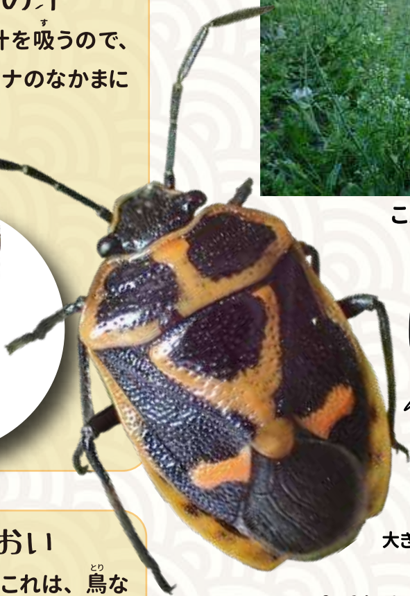
タネツケバナのなかま