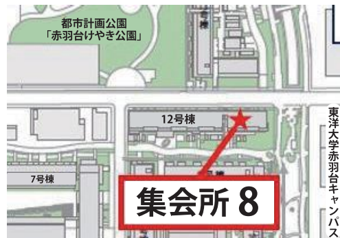
第2回説明会会場位置図