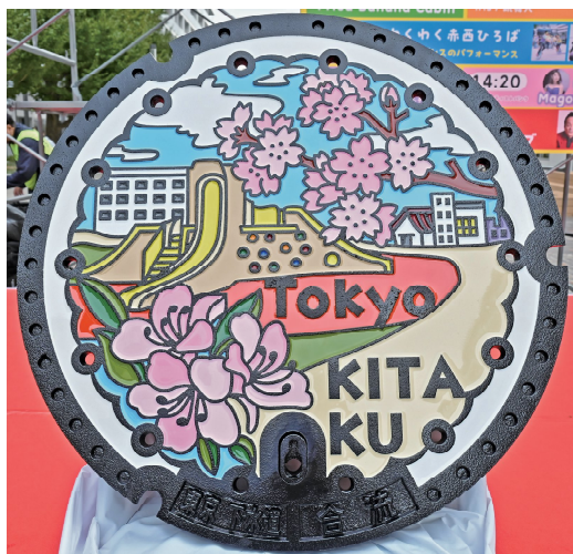
設置予定のデザインマンホール蓋

当日お披露目したマンホール蓋については、ヌーヴェル赤羽台いちよう通り南端の崖線区道に令和7年3月に設置を予定しています。