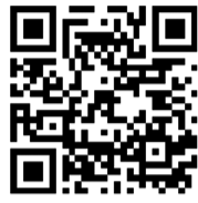
申込用二次元コード