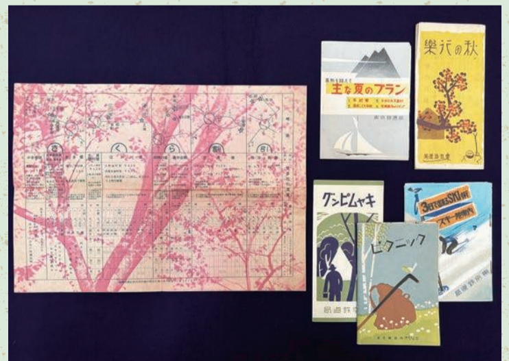
東京鉄道局が発行した旅に関するパンフレット類(北区飛鳥山博物館所蔵)