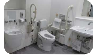
【バリアフリートイレ】