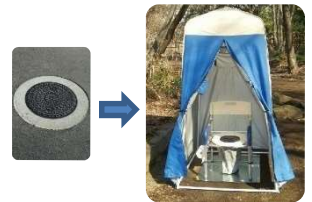
【マンホールトイレ】