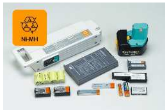
ニッケル水素電池