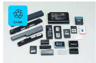
リチウムイオン電池

パソコンはリネットジャパンリサイクル株式会社の宅配便回収にて無料でお出しすることもできます。箱にパソコン本体が含まれれば、一緒に小型家電も無料でお出しできます。